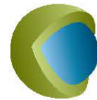
Recubrimiento grueso para una liberación controlada